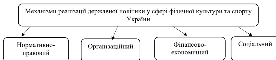
Рис. 1. Основні механізми реалізації державної політики у сфері фізичної культури і спорту, складено та узагальнено на основі аналізу джерел [3; 4]

Організаційними основами досліджуваного механізму є насамперед суб'єкти, які реалізують завдання, поставлені в цій сфері на підставі закону від 27 жовтня 2022 р. № 2438-ІХ. Закон України «Про фізичну культуру та спорт» (даний Законом) [5]. Їх слід поділити на два типи: перший – це предмети загальної компетенції. До них належать передусім Президент України, Уряд України, глави суб'єктів України та регіональних урядів. Їх функції зводяться до розробки та прийняття документів, що визначають розвиток сфери фізичного розвитку культури та спорту, впровадження